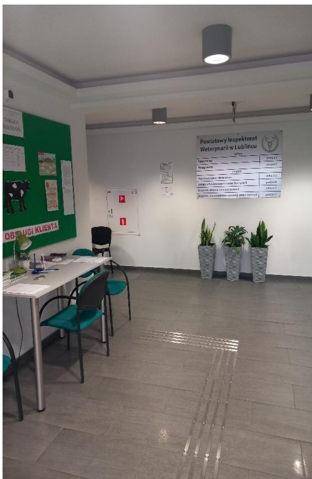
(zdjęcia przedstawiają: tablicę informacyjną, Punkt Obsługi Klienta oraz kącik dla dziecka)