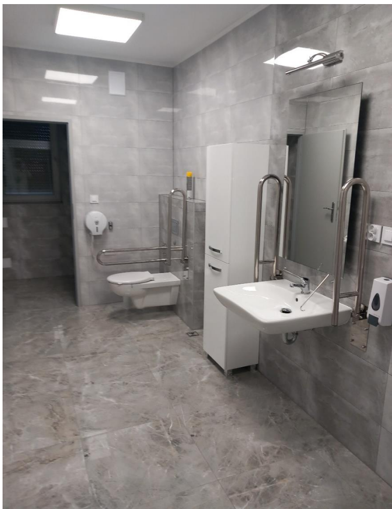
(zdjęcie przedstawia toaletę)

Jest w pełni dostosowana dla osób ze szczególnymi potrzebami.