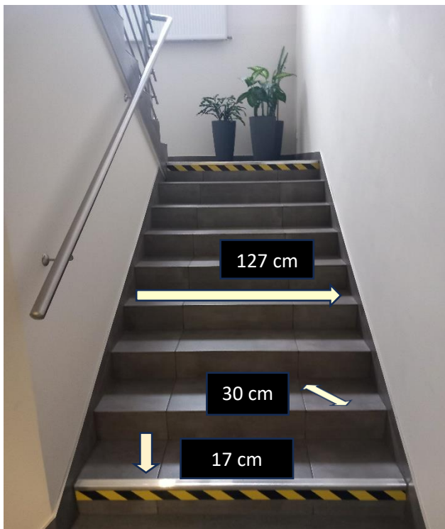
(zdjęcie przedstawia klatkę schodową)

Toaleta znajduje się na parterze za szklanymi drzwiami prowadzącymi do sekretariatu.