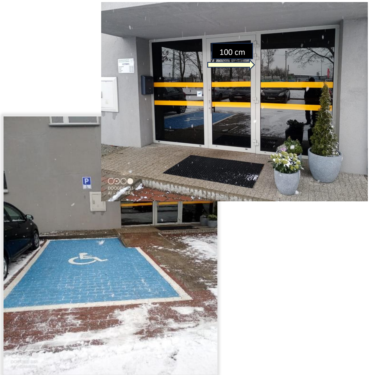
(zdjęcie przedstawia wejście główne do budynku Powiatowego Inspektoratu Weterynarii )

Otwierane są ręcznie, poprzez pociągnięcie pochwyty drzwiowego. Pochwyty jest podłużny, zamontowany pionowo . Jest poręczny, nie stwarza problemu w obsłudze.